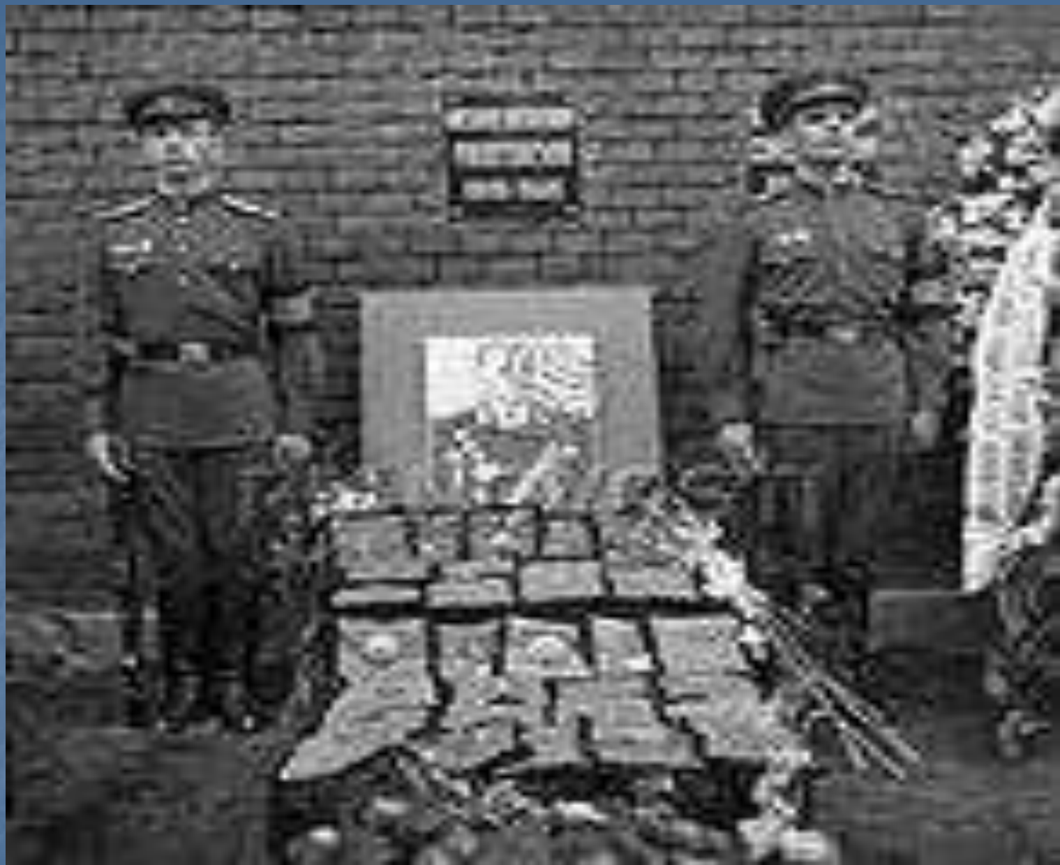
Умер К.К. Рокоссовский 3 августа 1968 г. На Красной площади находится урна с прахом