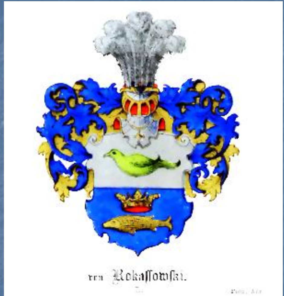
Герб рода Рокоссовских

Константин Константинович родился в городе Варшава 21-го декабря 1896 г. Отец - Ксаверий Юзеф Рокоссовский, ревизор Варшавской железной дороги польского происхождения. Мать - Антонина Овсянникова, белорусская учительница из города Телеханы