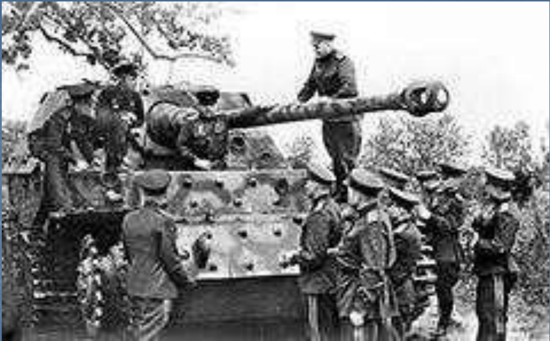
Командующий Центральным фронтом генерал армии К.К. Рокоссовский