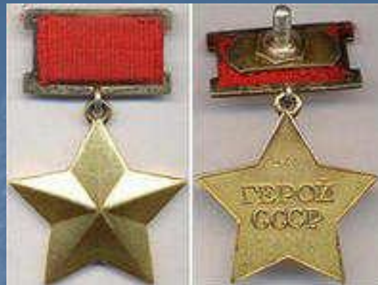
Звезда Героя Советского Союза