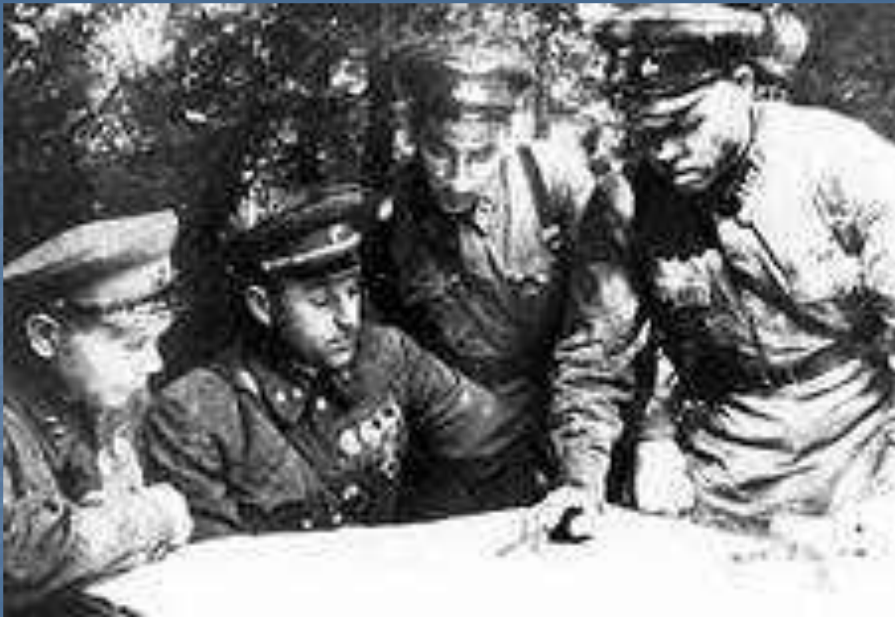
Штаб 16–й армии в районе Ярцева