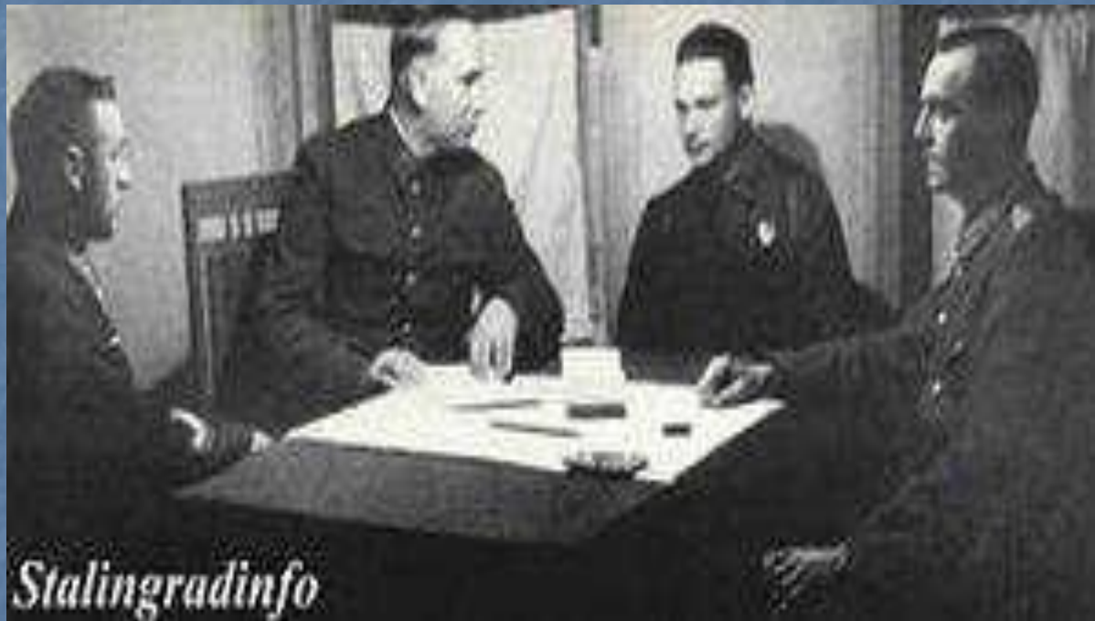
Рокоссовский допрашивает фон Паулюса