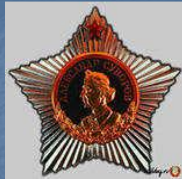
Орден Суворова 1 степени