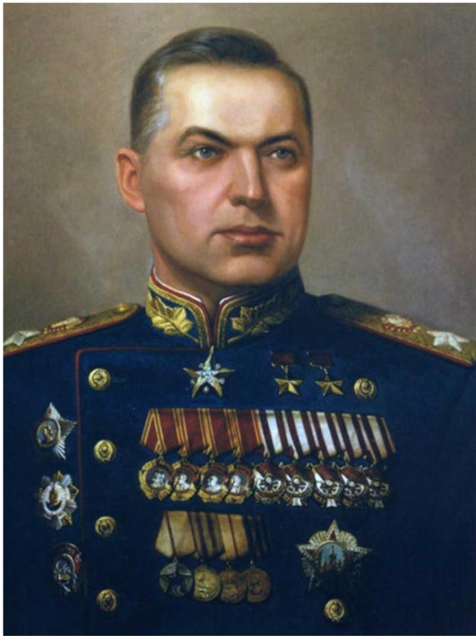
Константин Константинович Рокоссовский 1896 - 1968