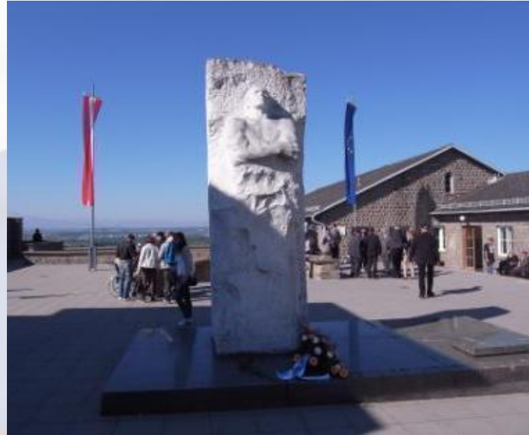
Памятник генералу Д. М. Карбышеву на территории бывшего концентрационного лагеря Маутхаузен, Австрия.

Тело Д. М. Карбышева было сожжено в печах Маутхаузена.