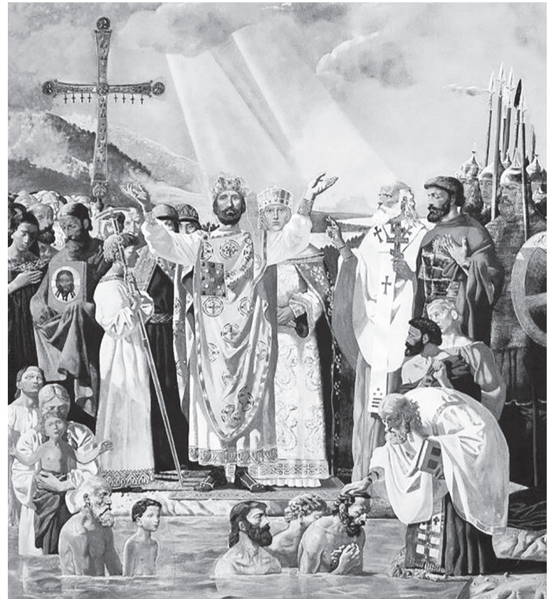
Фрагмент картины из соцсети: Крещение Руси.

День крещения Руси впервые отметили официально в 1888