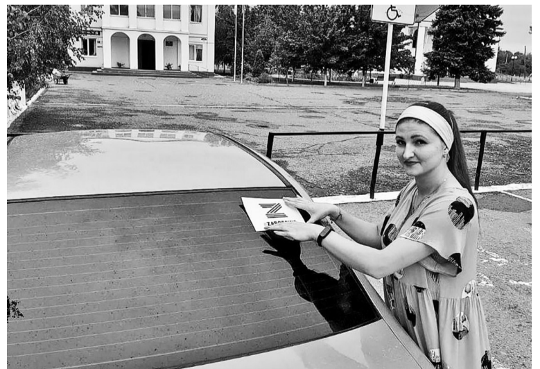
Распространение символических знаков Победы в селе Русском.

Недавно в ст. Стодеревской и селе Русском прошли подобные акции, в ходе которых волонтеры местных Домов культуры распространяли среди односельчан символические знаки «Z» и «V», крепя их на верхнюю одежду взрослых и детей; наклеивая на стёкла автомобилей и мобильные телефоны с разрешения их владельцев.