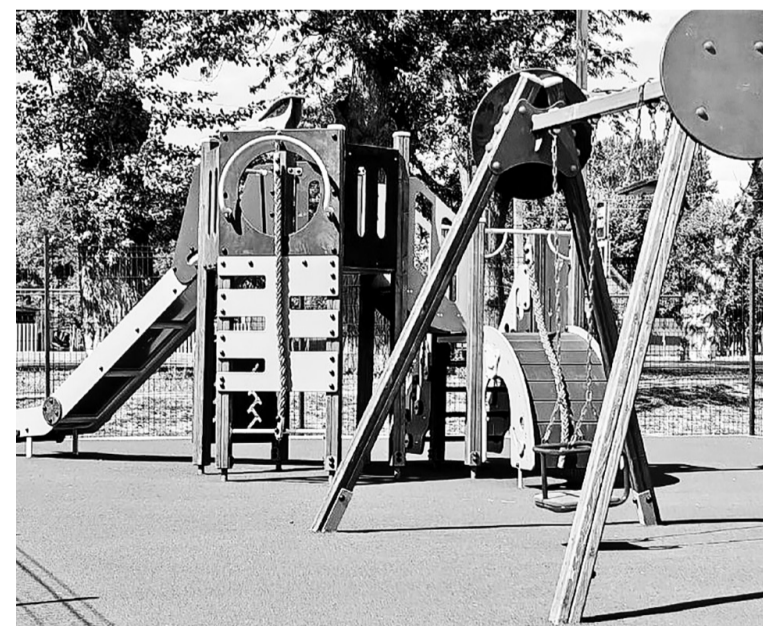
Фрагмент игровой площадки с. Уваровского.