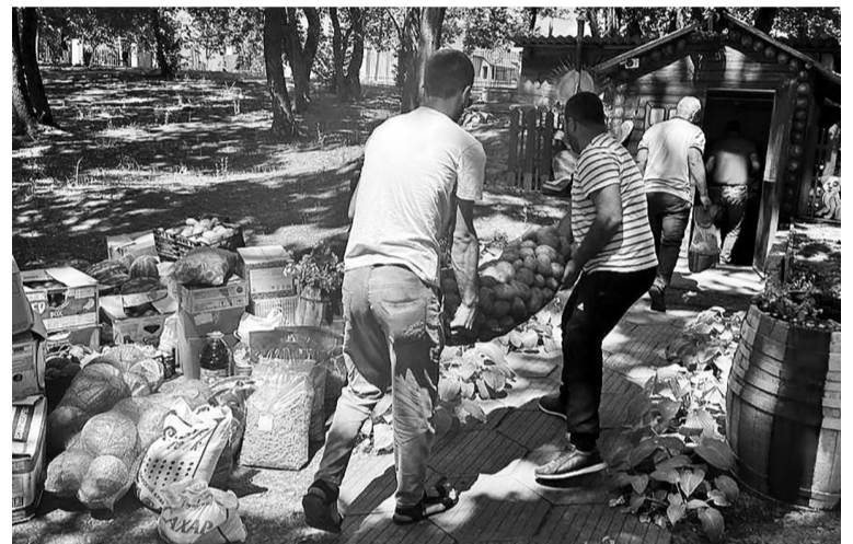
Турецкая община доставила продовольствие в Центр «Надежда».