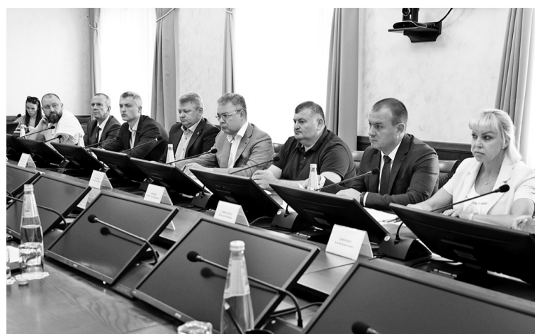
На Ставрополье планируется строительство инновационного лабораторного комплекса.

- Ставропольский край заинтересован в развитии, а развития без инвестиций быть не может. С группой компаний «Ташир» мы планируем реализацию проектов не только в сфере медицины, но и в ЖКХ. Перспективными направлениями являются