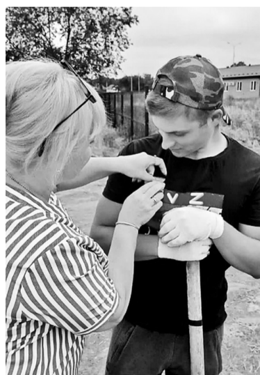
Символ юному стодеревцу.

Усиливающийся политический прессинг на Россию со стороны ряда европейских стран-недрузгов и США, не в состоянии переломить стойкость духа российского народа и его Вооружённых Сил, отстаивающих суверенитет и истинно человеческие ценности, присущие нашему Отечеству. Российская Армия взяла на вооружение латинские буквы «Z» и «V», как символы справедливой спецоперации против украинской националистической армии. Истинные патриоты страны всех возрастов твёрдо поддерживают международную