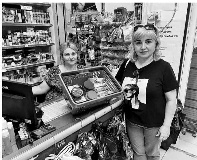
Продовольственные и промышленные товары Донбассу от предпринимателей Курского района.

Миролюбивый и гостеприимный Ставропольский край продолжает большую благотворительную акцию по оказанию всесторонней помощи жителям Народных Республик Донбасса.