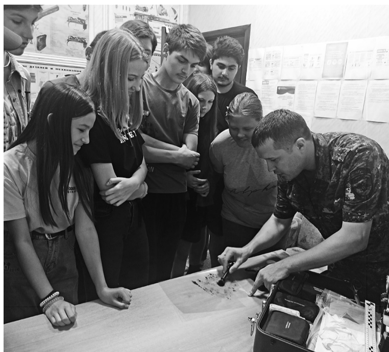
Ребята знакомятся с работой эксперта-криминалиста.

Отдел МВД России «Курский»